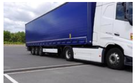
Die BIRCOsir-Rinnen entwässern nicht nur das Gelände, sondern erfüllen auch die Belastungskategorie für Schwerlastverkehre F900 nach DIN EN 1433