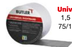
Universal Dichtband 1,5 mm, 10 m lang, 75/100/150 mm breit

Das Universal Dichtband ist ein vollflächig selbstklebendes Dichtband auf Bitumen-Basis mit einer schützenden Schicht aus polyesterverstärktem Aluminium zur wasser- und witterungsbeständigen Abdichtung von Anschlussnähten, Rissen und Lecks.