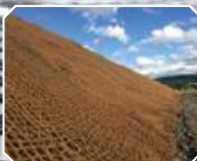
Erosionsschutz aus Jute- od. Kokosfasern