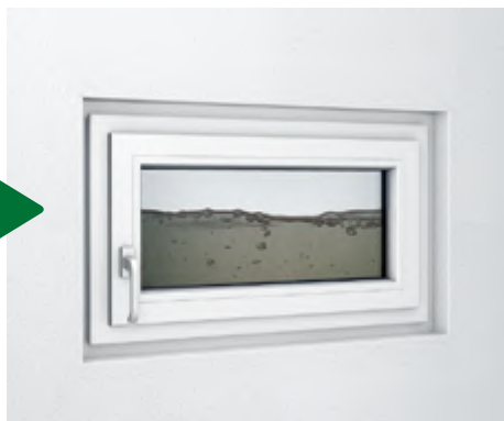
Umbau 1-fach verglastes Kippfenster in einer MEALUXIT Zarge auf Dreh-Kipp-Fenster